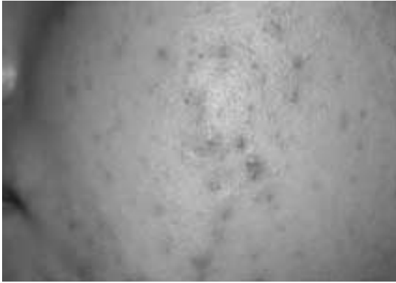
Acne papulopustulosa et comedonica

Auslöser einer Akne können Medikamente sein, welche die Talgdrüsenproduktion anregen, so zum Beispiel Glukokortikosteroide, Lithium, Androgene und Vitamin-B-haltige Vitaminpräparate. Bei Patientinnen muss immer auch an eine Kosmetika-induzierte Akne (Acne venenata) gedacht werden. Darüber hinaus kann Akne ein Begleitsymptom androgenisierender Erkrankungen sein, wie das Syndrom der poly-