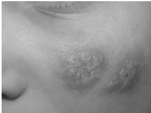
Rezidivierender Herpes simplex der linken Wange

die Lues – aufgrund ihrer stadienhaften Entwicklung mit Befall mehrerer Organe als «Chamäleon». Beim Biss einer mit B. burgdorferi , B. garinii oder B. afzelii infizierten Zecke (Durchseuchung ca. 35%) kommt es in der Hälfte der Fälle innerhalb von 48 Stunden zur Infektion (Durchseuchung der Bevölkerung in Mitteleuropa 10–15%). Folgende Stadien werden unterteilt: