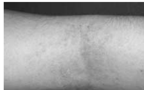
Atopische Dermatitis: Ekzema flexuratum (Beugeneckzeme)