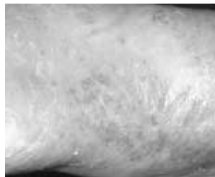
Psoriasis pustulosa plantaris – lokalisierte pustulöse Psoriasis der Fusssohle