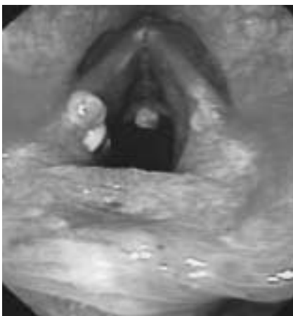
Abbildung 2: Refluxbedingte Pachydermie des posterioren Aspektes der Stimmbänder

der Reflux ein bedeutender aggravierender Faktor sein, dessen adäquate Behandlung mit PPI wesentlich zur Stabilisierung des Asthmas beiträgt.