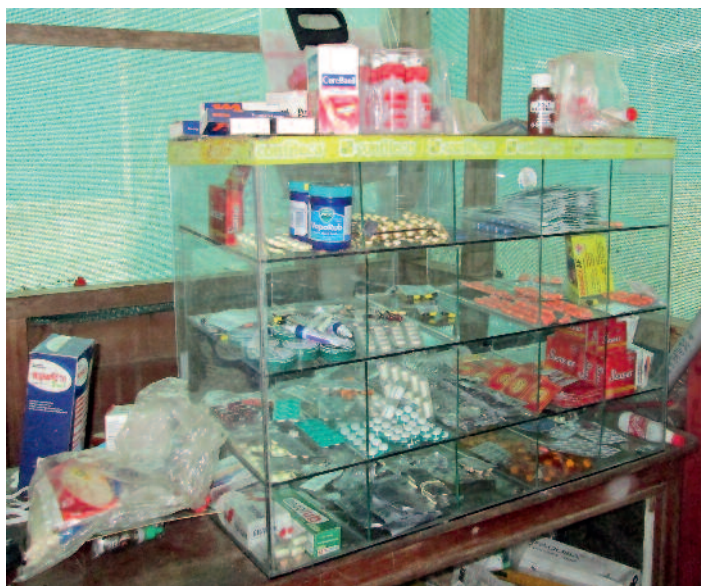
Apothek im Muro-Nationalpark, Peru

Cremes. Mikrobielle Kontamination kann allerdings auch unsichtbar vonstatten gehen. Im Zweifelsfall sollte man die Arzneimittel lieber nicht verwenden und bei Fieber oder grösseren Problemen innert 24 Stunden einen Arzt aufsuchen.