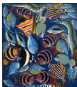
ARS MEDICI 8/16: Fische (verkauft!)