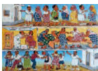
ARS MEDICI 7/16: Mütterberatung (verkauft!)