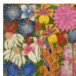
ARS MEDICI 10/16: Blumen (verkauft!)