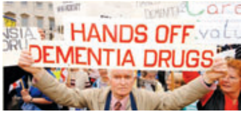
2006 gab es in England Proteste gegen die NICE-Entscheidung, den Einsatz von Antidementiva zu beschränken. Acetylcholinesterasehemmer gehören mit Memantin immer noch zu den einzigen befristet wirksamen Medikamenten.

mantin als Glutamatmodulator kommt nach Darstellung des Psychiaters im fortgeschrittenen Stadium der Demenz zum Einsatz.