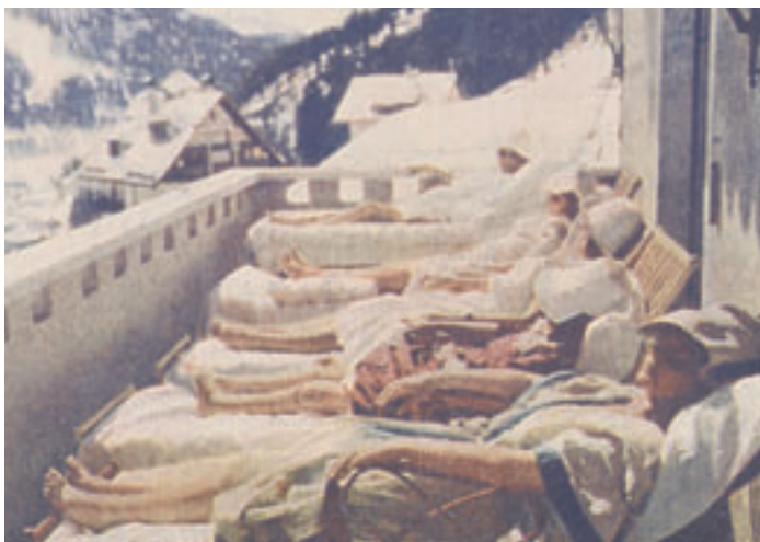
Patienten beim Sonnen auf einer Liegeterrasse der Bernhard-Klinik im Spätwinter.