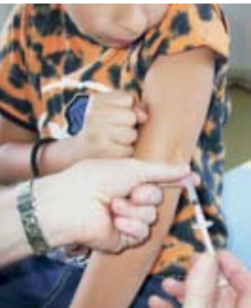
Abbildung 1: Subkutane Injektion der Allergene am Oberarm eines jungen Patienten im Rahmen einer SCIT

Nach wie vor gilt die subkutane Immuntherapie als Goldstandard der SIT. Für diese Applikationsform liegen die meisten Daten sowohl zur klinischen Wirksamkeit als auch zu den zugrunde liegenden immunologischen Mechanismen vor. Die Allergene werden subkutan am Oberarm injiziert (siehe Abbildung 1 ). Die Injektionen werden während der Steigerungsphase üblicherweise wöchentlich und in der Erhaltungsphase monatlich über drei Jahre durchgeführt. Neben der konventionellen ganzjährigen SCIT kann bei Pollenallergie auch eine präseasonale Kurzzeit-SCIT durchgeführt werden. Hier erhalten die Patienten zwei bis drei Monate vor der Pollensaison in wöchentlichen Therapieabständen nur die Injektionen der Steigerungsphase, die meist nach sieben Injektionen abgeschlossen ist. Es werden insgesamt drei präseasonale Therapiezyklen verabreicht, jedoch gilt die konventionelle ganzjährige Therapie als effektiver.