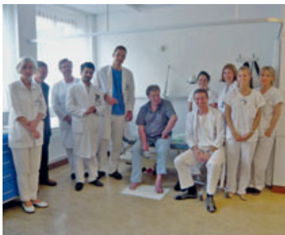
Abbildung 3: Sprechstunde im Wundzentrum am Universitätsspital Zürich

Die Umsetzung von neuen Erkenntnissen, die interdisziplinäre Zusammenarbeit, den fachlichen Austausch und die Informationsverteilung, unter anderem via Website und Blog, fördert die SAfW mit diversen Aktivitäten. Sie unterstützt wissenschaftliche Projekte und setzt sich für regulatorische Aspekte ein: die Festlegung der Tarifpositionen für Wundbehandlung sowie der Richtlinien für die Wund-