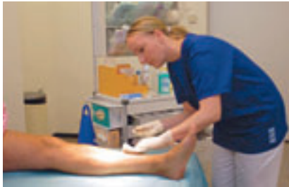
Abbildung 2: Arbeit der Wundexpertin in einem gut eingerichteten Wundambulatorium

sonen zugewiesen und somit einer prompten, adäquaten Behandlung zugeführt werden. Einige Spitex-Regionalverbände fördern die Zusammenarbeit durch regelmässigen Austausch, beispielsweise Businesslunches mit den Hausärzten, oft mit beachtlichem Erfolg für die Patientenversorgung, dem letztlich Wichtigsten.