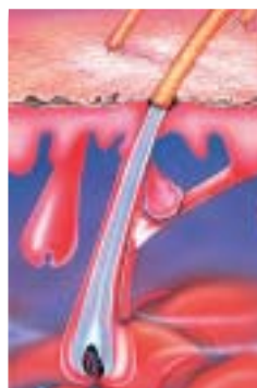
Anagene Phase: Der Follikel produziert ein vollständig ausgebildetes Haar (durchschnittlich 3 Jahre).