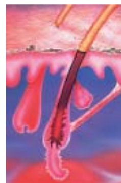
Katagene Phase: Der Follikel schrumpft und zieht sich vom Haarende zurück (1 bis 2 Wochen).