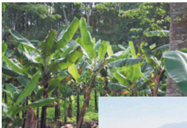
In tropischen Breiten, wo es Wasser und Menschen gibt, ist auch die Malaria heimisch.

psychiatrischen Nebenwirkungen wie zum Beispiel Depressionen nur noch für Personen, welche die Substanz nachweislich vertragen oder bereit sind, vor der Abreise einen Verträglichkeitstest durchzuführen. Dabei wird eine sogenannte «Loading-Dose» verabreicht: eine Mefloquintablette an 3 aufeinanderfolgenden Tagen. Durch die rasche Aufsättigung des Serumspiegels werden mögliche Unverträglichkeiten oder Nebenwirkungen rasch sichtbar.