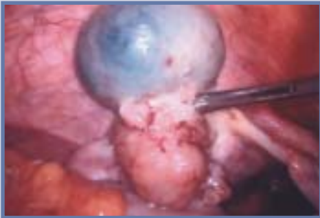
Situs eines frühen und ...