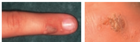
Abbildung 1: Warzen: Hände und Füße sind Prädilektionsstellen

Kutane Warzen treten im Kindes- und Jugendalter besonders gehäuft auf, wobei der Altersgipfel bei den 12- bis 16-Jährigen liegt. Rund 10 bis 22 Prozent der Schulkinder in Industrienationen sind betroffen, Mädchen häufiger als Knaben. Warzen treten bei 70 Prozent der Erkrankten an den Händen auf (4, 5) (Abbildung 1). Eine Ansteckung erfolgt entweder durch direkten Körperkontakt, über kontaminierte Gegenstände oder auch in Feuchtbereichen wie Schwimmbad, Sauna, aber auch in Turnhallen oder Hotelzimmern. Die HPV-Infektion gehört zu den häufigsten sexuell übertragenen Krankheiten. Bei infizierten Schwangeren besteht ein Risiko zur peri- oder postnatalen Übertragung auf das Neugeborene.