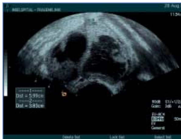
Abbildung 1: Zystische, septierte Raumforderung im Adnexitätsbereich beidseitig

Anamnestisch werden unregelmässige Menstruationen bei Menarche vor vier Jahren festgestellt. Es besteht keine Dysmenorrhö. Die Patientin hat bereits regelmässig Geschlechtsverkehr, wovon die Eltern nichts wissen. Es besteht keine Dyspareunie. Der letzte Kontakt fand vor