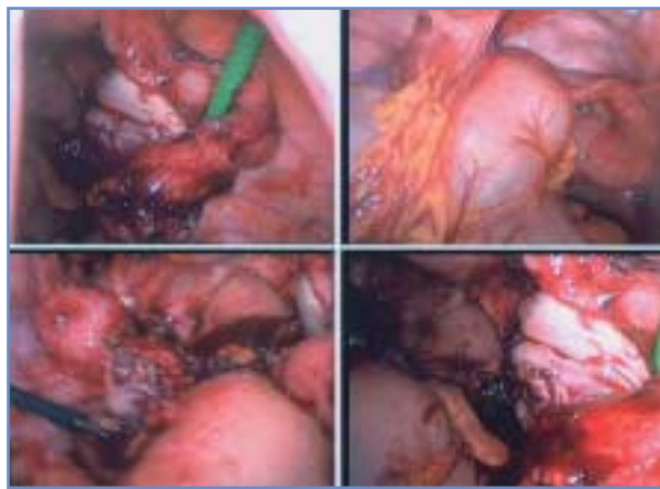
Abbildung 3: Eiter, welcher sich aus der Abszeshöhle zwischen Sigma und Tube entleert