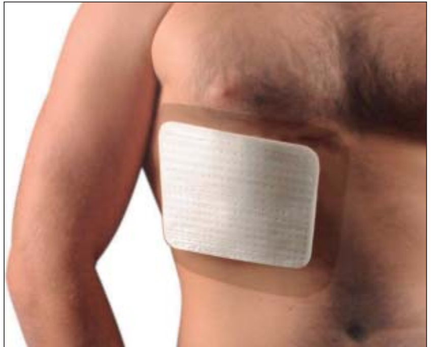
Abbildung: Angelegte Rippenschiene.

Das Prinzip ist einfach: Statt wie in früheren Jahrhunderten und bis heute üblich alle Rippen zirkulär mit einem Gürtel oder einem Verband einzuschränken, wird lokal, das heisst auf die gebrochene Stelle, eine 12 x 12 bis 17 x 17 cm grosse, harte, aber formbare Aluminium-Rippenschiene aufgeklebt. Das erfordert nur wenige Sekunden. Die Rippenschiene bewirkt, dass die auf diese Weise fixierten, ober- und unterhalb der Frakturstelle liegenden gesunden Rippen die Frakturstelle mitfixieren und immobilisieren. Eine die Orthese umgebende wasserdichte Folie ermöglicht darüber hinaus eine normale Körperpflege.